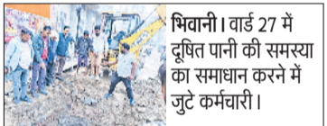
भिवानी। वार्ड 27 में दूषित पानी की समस्या का समाधान करने में जुटे कर्मचारी।

स्थिति इतनी गंभीर थी कि स्थानीय लोग टाइफाइड, डायरिया और हेपेटाइटिस जैसी बीमारियों के शिकार हो रहे थे। इस समस्या को लेकर क्षेत्रवासी काफी परेशान थे और उन्होंने जनस्वास्थ्य विभाग के उच्च अधिकारियों से