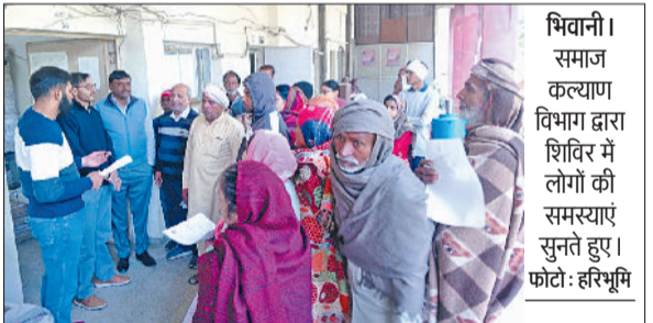
मिवाणी। समाज कल्याण विभाग द्वारा शिविर में लोगों की समस्याएं सुनते हुए।