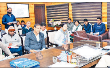
भिवानी। बैठक में अधिकारियों को दिशा निर्देश देते उपायुक्त।