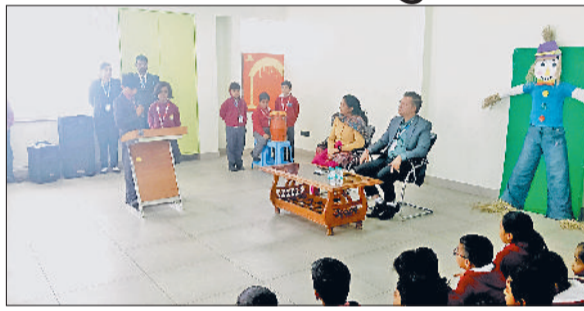
बवानीखेड़ा। स्कूल में आयोजित कार्यक्रम में उपस्थित बच्चे व शिक्षक।

बवानी खेड़ा के बी.के.वरिष्ठ माध्यमिक विद्यालय में 'लैंगिक समानता' विषय के ऊपर लघु कार्यशाला का आयोजन किया गया। विद्यार्थियों ने विभिन्न गतिविधियों के माध्यम से अपनी भावनाएं प्रकट कीं। इस कार्यशाला में कक्षा तीसरी से कक्षा पांचवी तक के विद्यार्थियों ने भाग लिया।