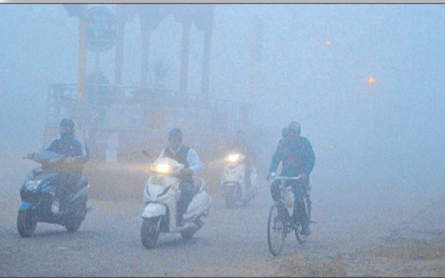
भिवानी। धुंध को चिरकर गंतव्य की ओर जाते वाहन चालक और स्कूल में जाते विद्यार्थी।

रोडवेज ने बसों की गति घटाई गंतव्य तक लग रहा दोगुना समय