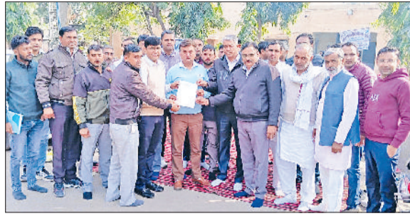
मिवानी । ऑन लाइन पालिसी के विरोध में मांगपत्र सौंपते हुए ।

ऑनलाइन ट्रांसफर पालिसी के विरोध में बिजली कर्मचारियों ने शुक्रवार को यहां कार्यकारी अभियंता के कार्यालय के सामने जोरदार नारेबाजी की। कर्मचारियों ने अपनी मांगों को लेकर कार्यकारी अभियंता के माध्यम से अतिरिक्त मुख्य सचिव (पावर) को जापन सौंपा, जिसमें तुरंत प्रभाव से ऑनलाइन ट्रांसफर पालिसी को वापिस लेने की मांग की। कर्मचारियों ने सरकार को चेताया कि ऑनलाइन ट्रांसफर पालिसी अगर वापिस नहीं ली गई तो इसके भीषण परिणाम होंगे।