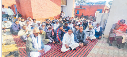
भिवानी। जनस्वास्थ्य विभाग यूनिन के चुनाव में भागीदारी करते कर्मचारी।