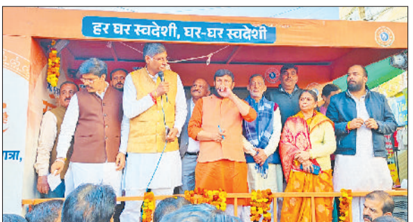
मिवाणी। आयोजित कार्यक्रम में मंवासीन पदाधिकारी।

स्वदेशी उत्पादों के प्रति जागरूक करना और स्थानीय उद्योगों को बढ़ावा देना है। जिसके तहत प्रत्येक जिला में धूमकर यह रथ लोगों को