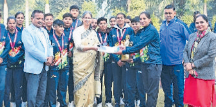
भिवानी। प्रतिभागियों को सम्मानित करते हुए।

भार में स्वर्ण पदक, निशा ने 75 में रजत पदक एवं खिलाड़ी दक्ष ने 92 में कांस्य पदक तथा कुश्ती ग्रीको में खिलाड़ी राजीव ने 60 में रजत पदक जीतकर अपनी प्रतिभा का लोहा मनवाया है। खेलो इंडिया गेम्स