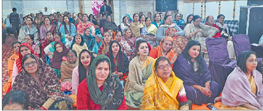
मिवाणी। सत्संग में उपस्थित महिलाएं।